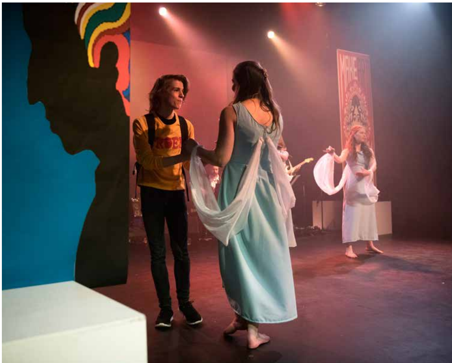
FÅR ROS: De unge skuespillerne får ros av vår anmelder for sine tolkninger av Bob Dylan.