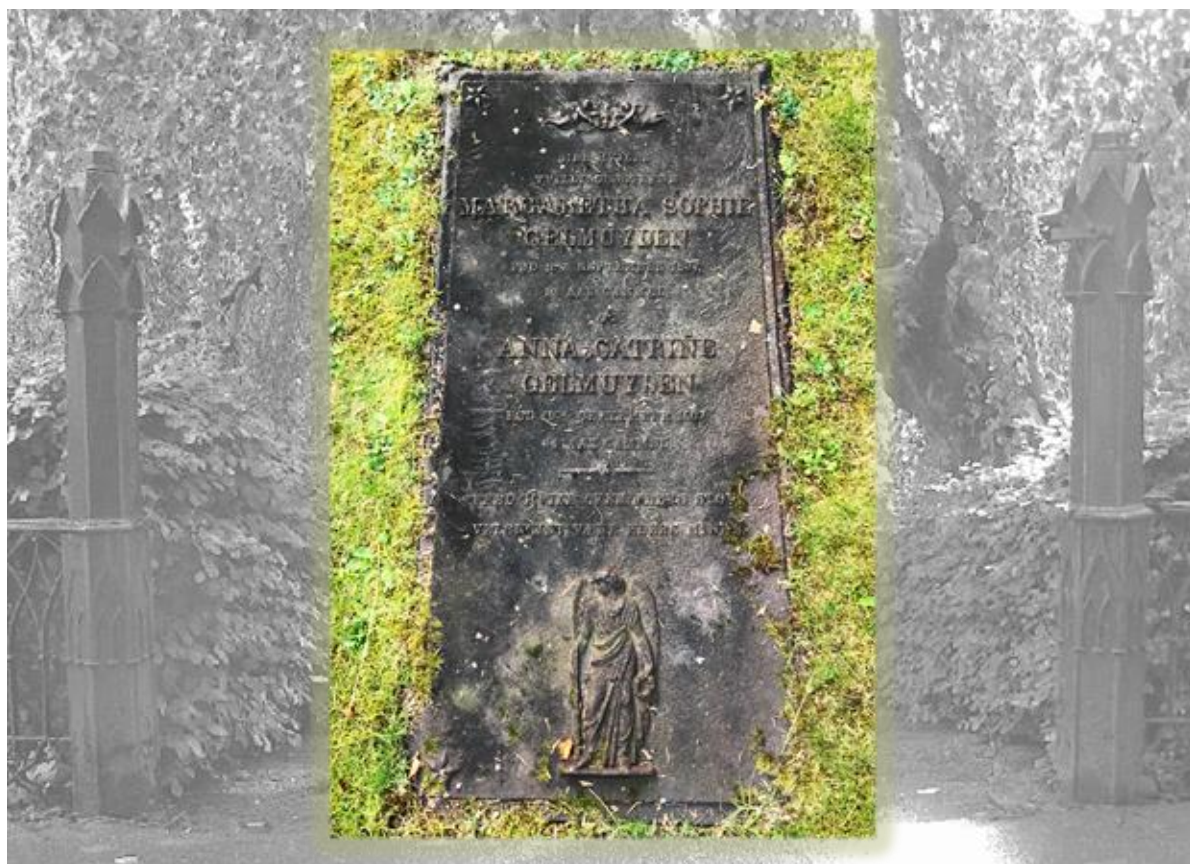
Foto: Geelmuyden-tvillingenes gravstein