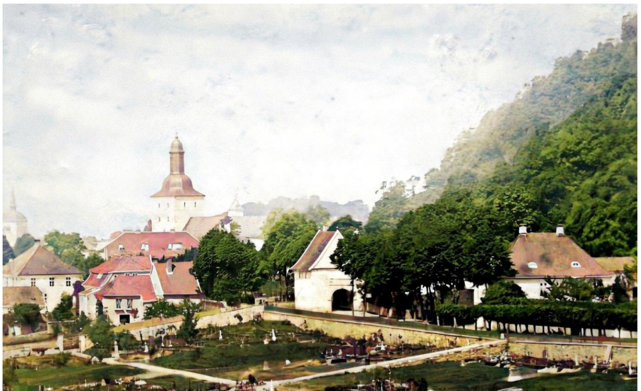
Foto: Pleiestiftelsen, Kalfaret og Assistentkirkegården 1861.