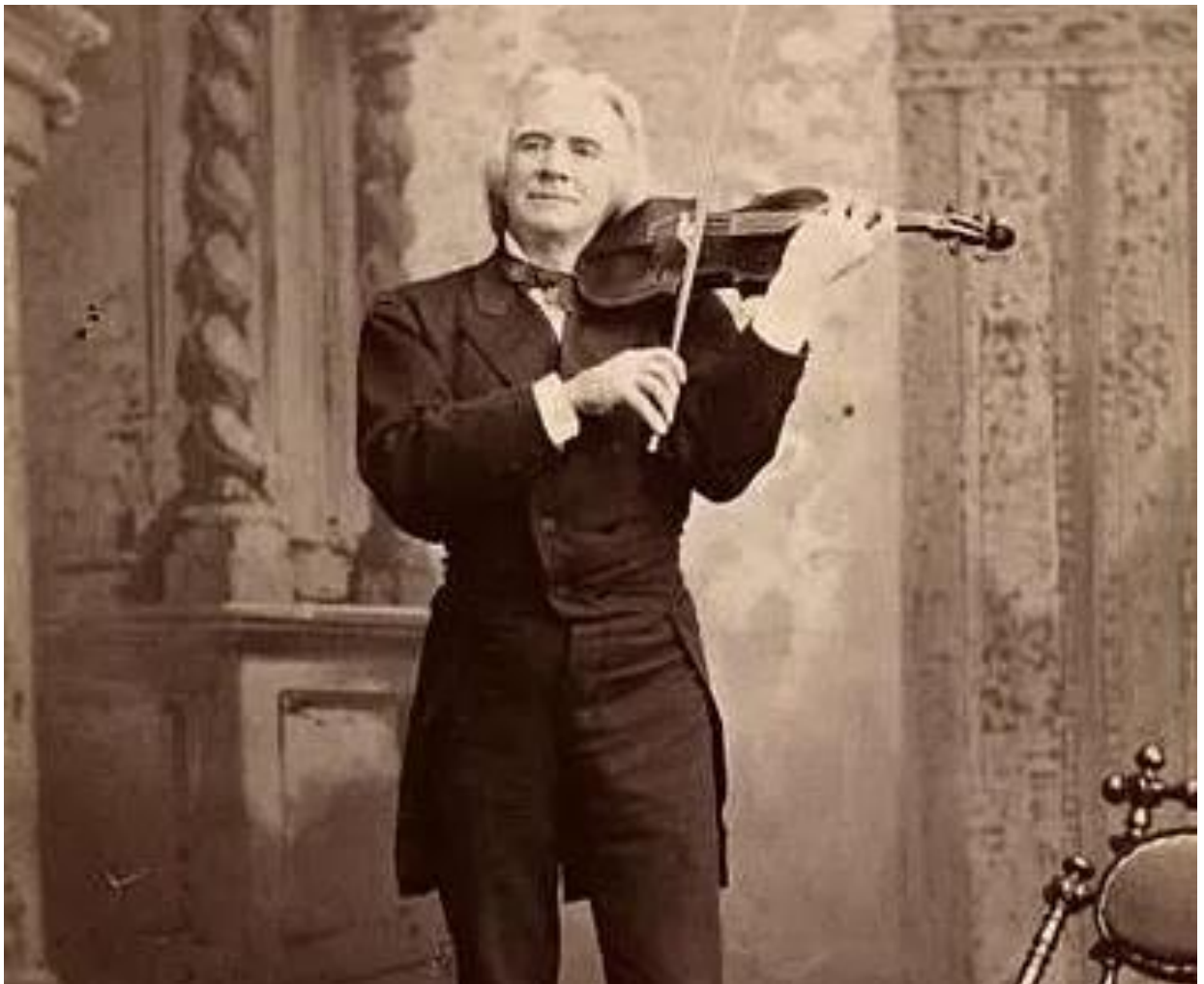
Fotografi av Ole Bull