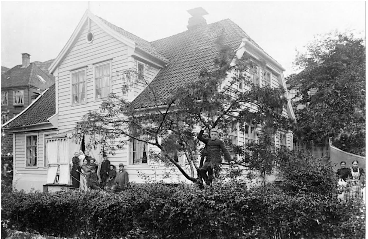
Foto: Slakterfamilien Johan Stokman Olsens hus i Skuteviken.